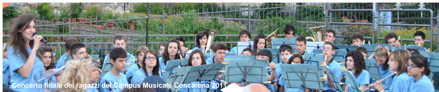
Concerto finale dei ragazzi del Campus Musicale Concarena 2011